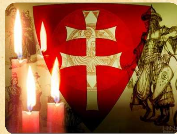
Rakúsko-Uhorské korunovačné klenoty