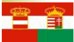
Rakúsko - Uhorsko

☞ Na prelome 19 a 20. storočia o svoje postavenie v Európe súperilo šesť veľmocí => Nemecko, Rakúsko – Uhorsko, Francúzsko, Veľká Británia, Rusko a Taliansko