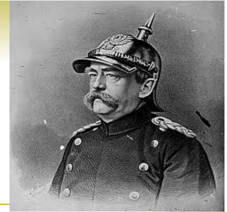
Otto von Bismarck