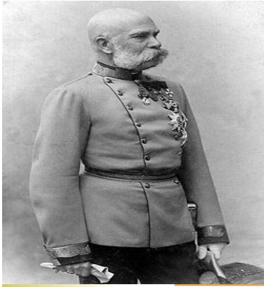
František Jozef I.