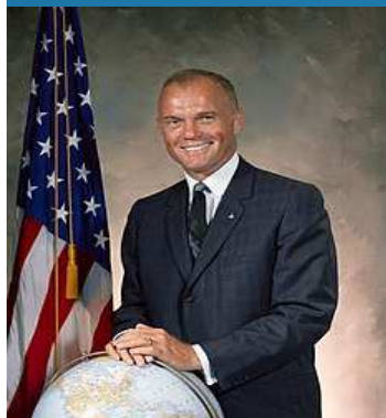
USA - 1962