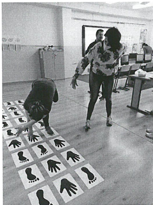
Obrázok 1 Návrh aktivít na ochranu duševného zdravia žiakov